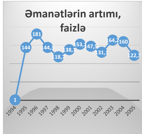
Şəkil 3. Əmanətlərin artımı, faizlə